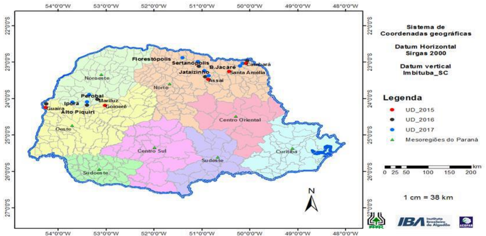
Figura1. Localização das unidades demonstrativas de algodão do Projeto safra 2015_2017